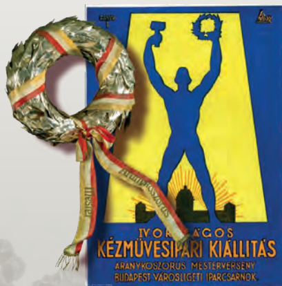
Aranykoszorús mesterverseny díja és plakátja