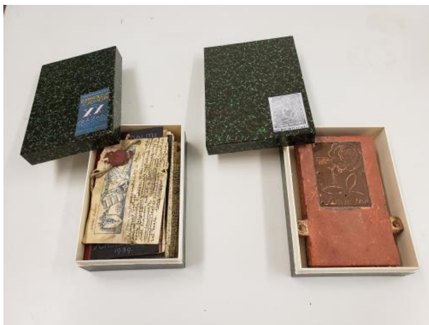
A papírvágógéppel készült méretre szabott műtárgytároló dobozok

A pályázati keretből vásárolt eszközök a mindennapi munka hatékonyabb, pontosabb elvégzését teszik lehetővé, elősegítik a megfelelő tárolási feltételek kialakítását. A régészeti fémek vákuum géppel történő csomagolása a gyorsabb munka mellett a minimális beavatkozás elvét követve jövőbeni műszeres vizsgálatok, modernebb eljárások elvégzését is lehetővé teszik.