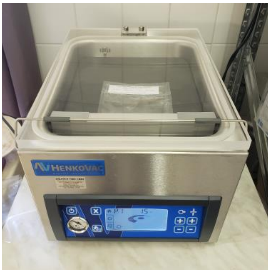
A vákuum gép munka közben

A vákuumcsomagoló gép felhasználható kisebb tárgyak, textilek, könyvek, rovarmentesítésére is. Az eljárás lényege, hogy a vákuumozáskor a gép anaerob, oxigénmentes környezetet hoz létre. Az így lezárt tasakban az élőlények néhány hét alatt elpusztulnak, nincs szükség vegyszeres kezelésre.