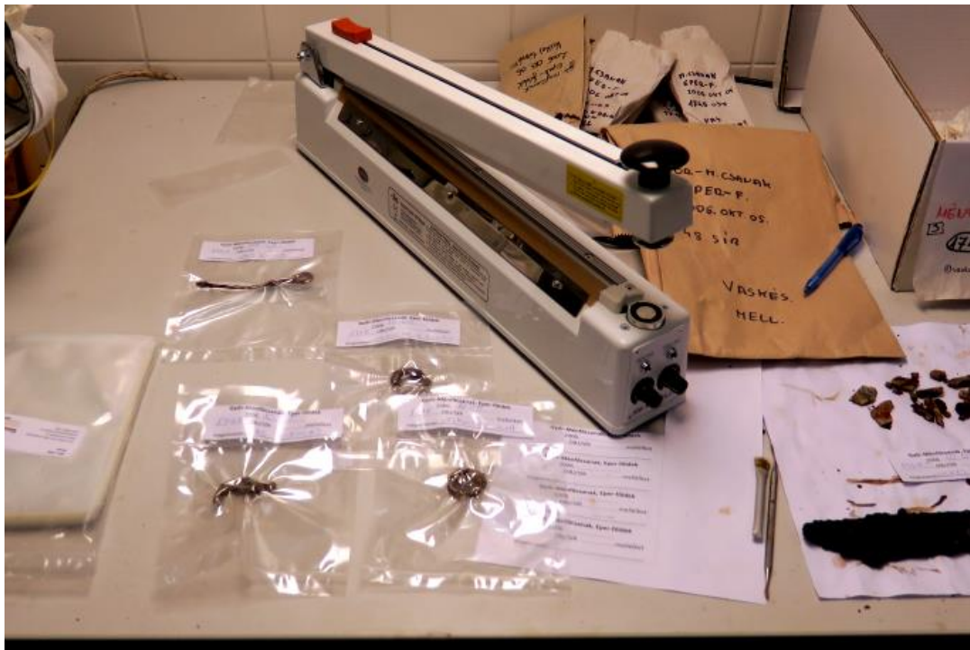
A hegesztő-vágó géppel méretre szabott tasakok készíthetők