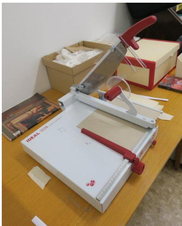
A kisebb vágógép vastagabb lemezek, kötéstáblák leszabására is alkalmas