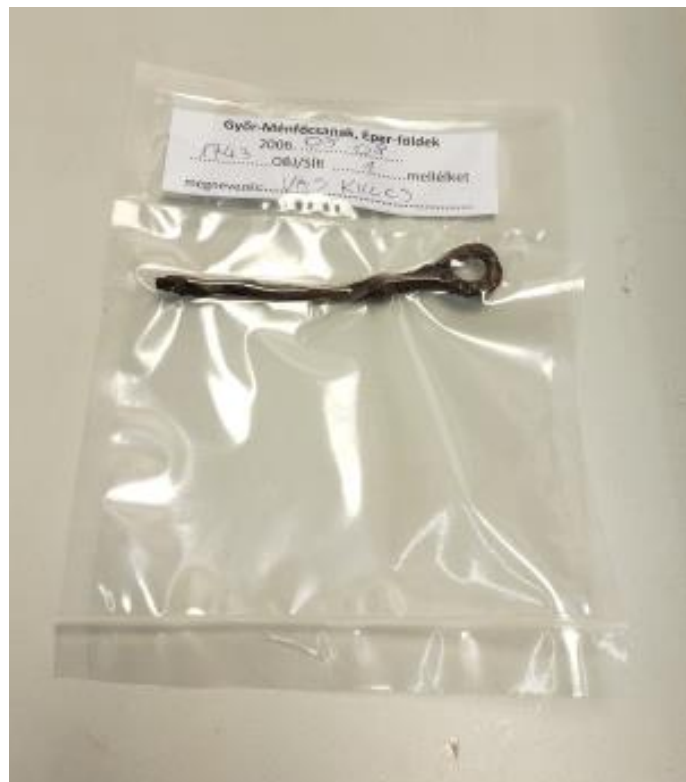
Kelta vaskulcs vákuumcsomagolásban